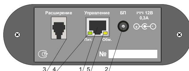
Рис. 2.2. Вид задней панели.

поз.4: индикатор "Пит.", индицирует наличие питания устройства ;