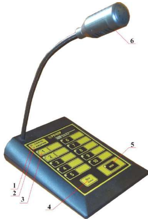
Рис. 2.1. Вид передней панели РДУ.